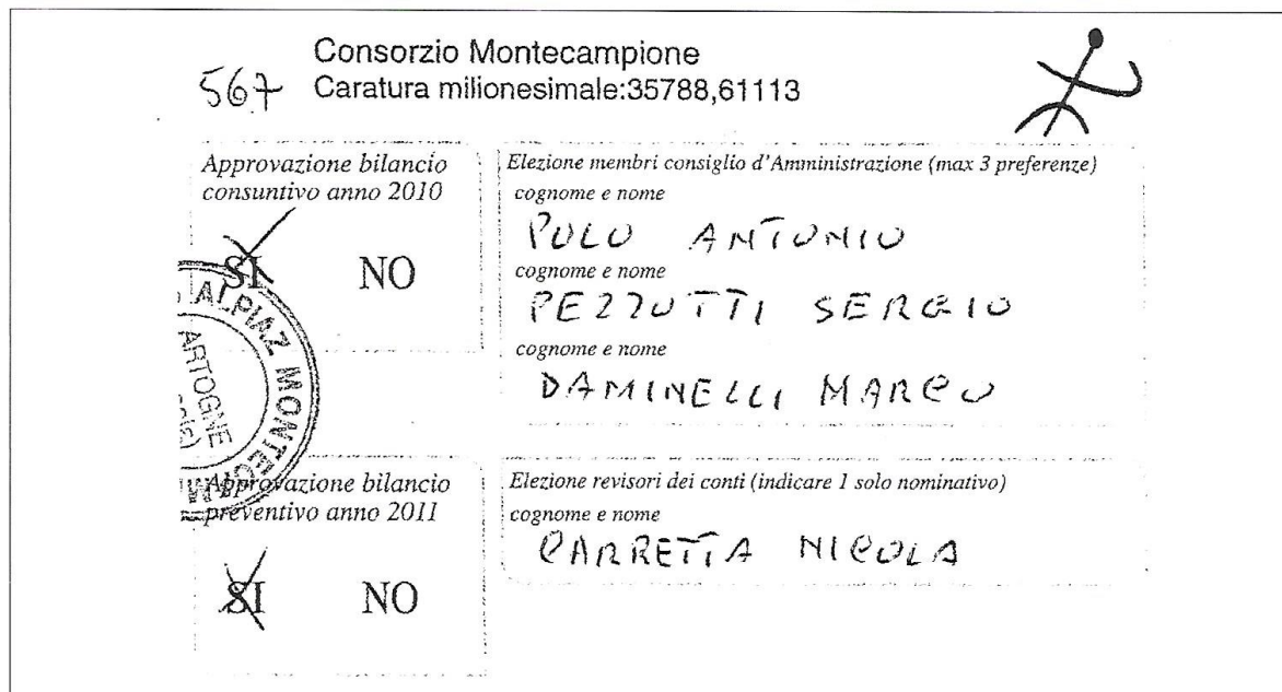
Scheda Alpiaz della multiproprietà di 35.788,61113 milionesimi

Pubblichiamo le prove delle menzogne ai Montecampionesi: le schede di Alpiaz usate per il "gioco dei quattro"